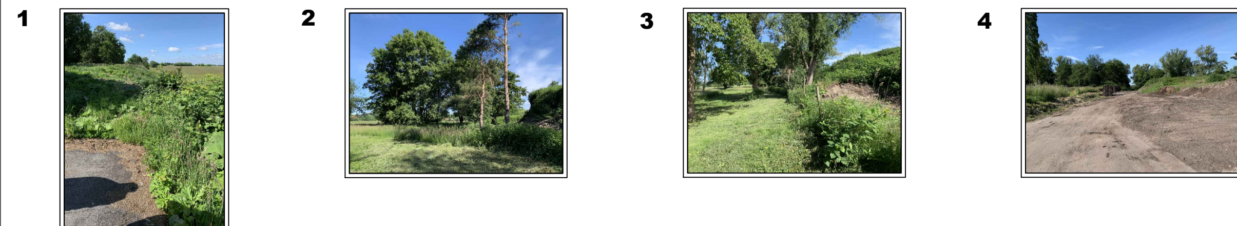
Stand: 16.06.2022

Plangrundlage: Vermessungsbüro Felshart (ObVI) Haderslebener Straße 14a 25421 Pinneberg Stadt: Uetersen Gemarkung: Uetersen Flur: 18